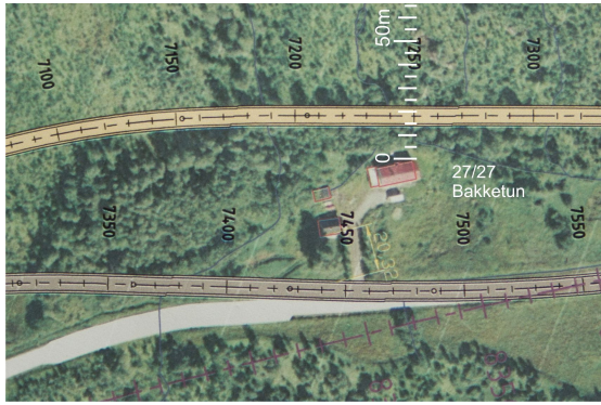
Her er veien tegnet 15m fra bolighus